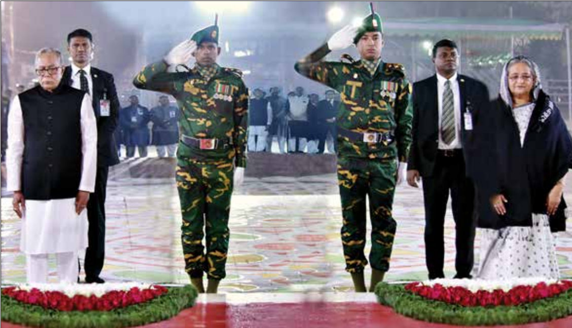
গত ২১ ফেব্রুয়ারি ২০১৮ এর প্রথম প্রহরে মহান শহীদ দিবস ও আন্তর্জাতিক মাতৃভাষা দিবস উপলক্ষে কেন্দ্রীয় শহীদ মিনারে ভাষা শহীদদের প্রতি শ্রদ্ধা নিবেদন করে পুষ্পস্তবক অর্পণ করেন রাষ্ট্রপতি মো: আব্দুল হামিদ এবং প্রধানমন্ত্রী শেখ হাসিনা।