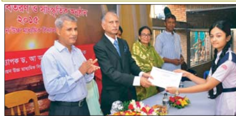
উদয়ন উচ্চ মাধ্যমিক বিদ্যালয়ের বার্ষিক পুরস্কার বিতরণ ও সাংস্কৃতিক অনুষ্ঠান গত ১৭ সেপ্টেম্বর ২০১৫ বিদ্যালয় প্রাঙ্গণে অনুষ্ঠিত হয়। এতে উপাচার্য ও উদয়ন উচ্চ মাধ্যমিক বিদ্যালয়ের গর্ভনীর বার্ষিক সজাগচিত অধ্যাপক ড. আ.আ.ম.স আরেফিন সিদ্দিক প্রধান অতিথি হিসেবে উপস্থিত থেকে বিজ্ঞানের মাস পুরস্কার বিতরণ করেন।