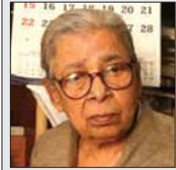
গত ২৮ জুলাই ২০১৬ এক শোকবাণীতে উপাচার্য বলেন, মহাশ্বেতা দেবী ছিলেন বাঙালি